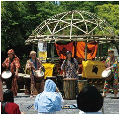
掲載の写真はイメージです